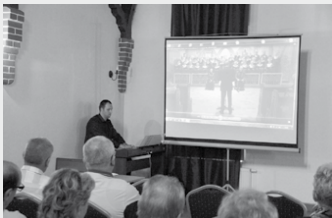
Koncert dla seniorów